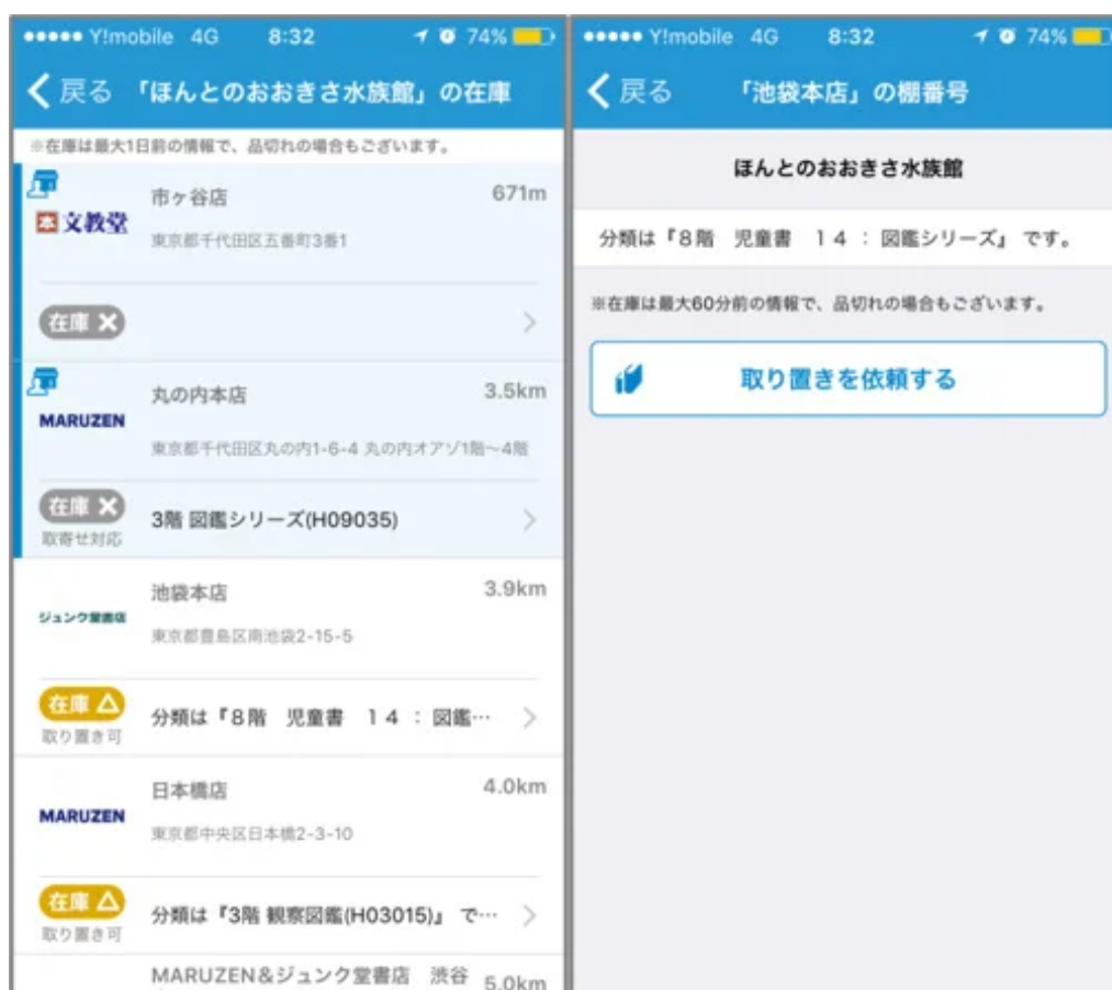
「取り置き」依頼画面イメージ