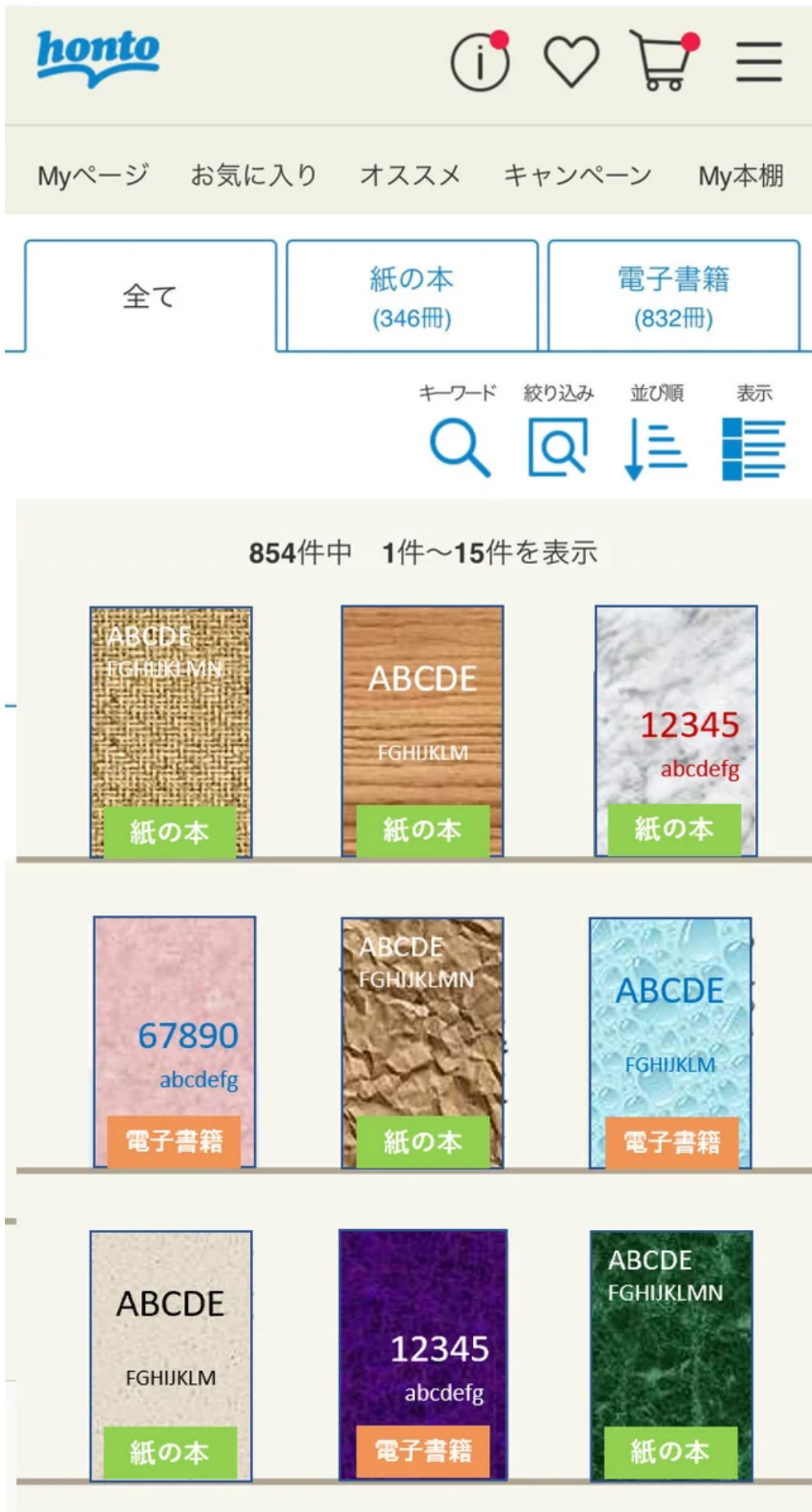
「マイ本棚」画面イメージ

リアル書店でもネット書店でも、hontoで購入した本が自動で登録される蔵書管理機能。他書店での購入や図書館で読んだ本などは、自分で登録することもできます。気になる本は紙の本でも