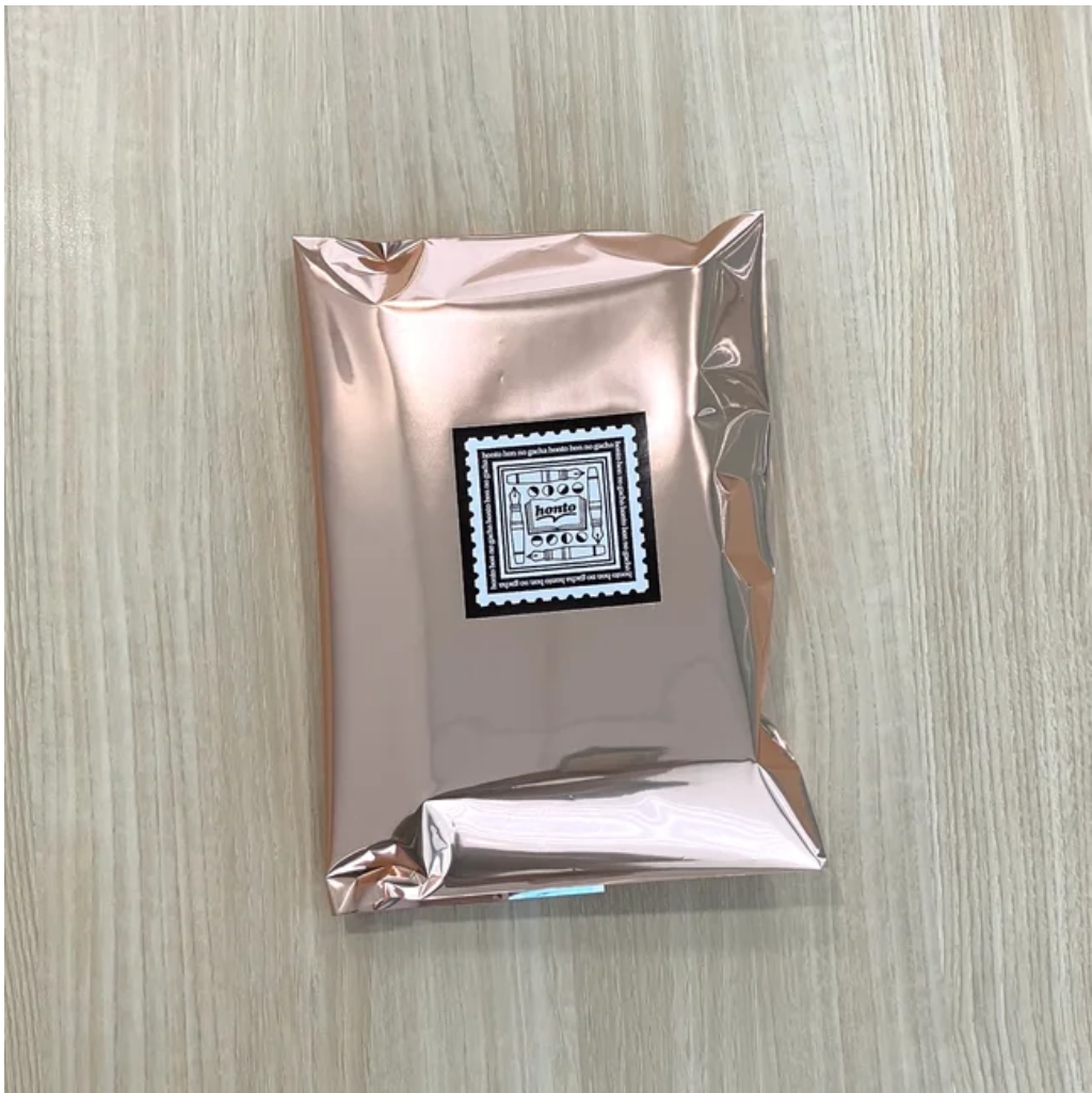
外装イメージ 「本のガチャ®×手紙」 オリジナルデザインのステッカーが目印