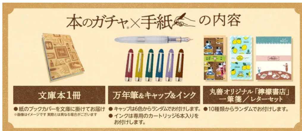
「本のガチャ®×手紙」のセット内容

honto書店員が約6万タイトルの文庫から「手紙」をテーマに選書し、万年筆とキャップとインク、そして一筆箋（もしくはレターセット）をセットにした商品です。