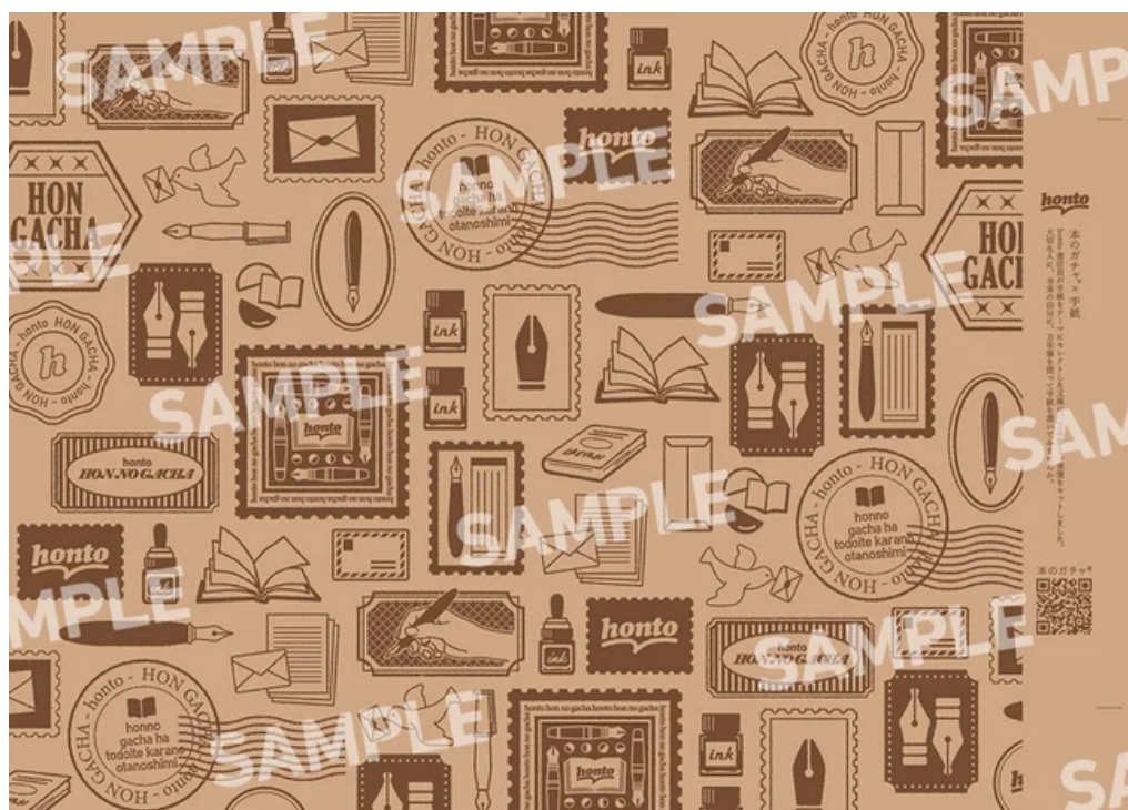
「本のガチャ®×手紙」オリジナルデザインのブックカバーが掛けられた状態で文庫が届きます

セットの万年筆およびキャップ・インクは、書店を中心に販売され、手に取りやすい価格帯と透明のボディが人気の日本出版販売株式会社のオリジナル商品「Fonte（フォンテ）」シリーズを、一筆箋（レターセット）は丸善ジュンク堂書店と古川紙工株式会社のコラボレーション文具シリーズ「檸檬書店（れもんしょてん）」を各々ランダム1種ずつ、文庫とともにお届けします。